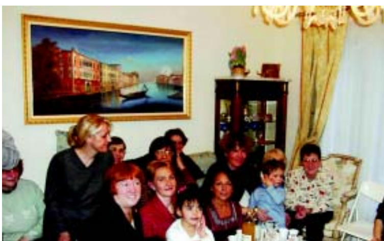
Notre rencontre de Janvier 2003   l'occasion de la galette des rois : le Docteur Claude Fugain entour e de ses patients

CISIC Si ge social : 57 Avenue Schildge 91120 Palaiseau Secr tariat : 01 49 28 26 65 http://assoc.wanadoo.fr/implant.cochleaire/ e-mail : cisic@wanadoo.fr